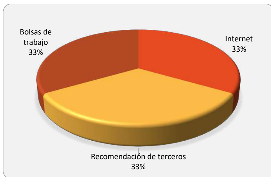
Gráfica 2.1 Medios de reclutamiento más utilizados por los empleadores

La Gráfica 2.1 muestra los medios de reclutamiento para el proceso de contratación observándose que el mayormente utilizado por los empleadores y/o personal de recursos humanos es a través de la recomendación de terceros, las bolsas de trabajo y el internet.