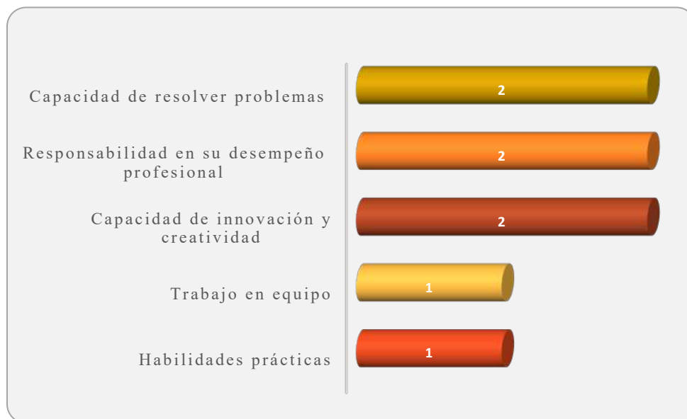
Gráfica 3.1 Aspectos más importantes que poseen los egresados de esta licenciatura, considerados por los empleadores

En la Gráfica 3.1 se observan las capacidades mencionadas por los empleadores que son fundamentales para la contratación de los egresados de este Programa Educativo, destacando la capacidad de resolver problemas, la responsabilidad en su desempeño profesional y la capacidad de innovación y creatividad indicado por los 2 empleadores que participaron en la encuesta. Otras capacidades consideradas fueron: el trabajo en equipo y las habilidades prácticas, como se muestra en la Gráfica 3.1.