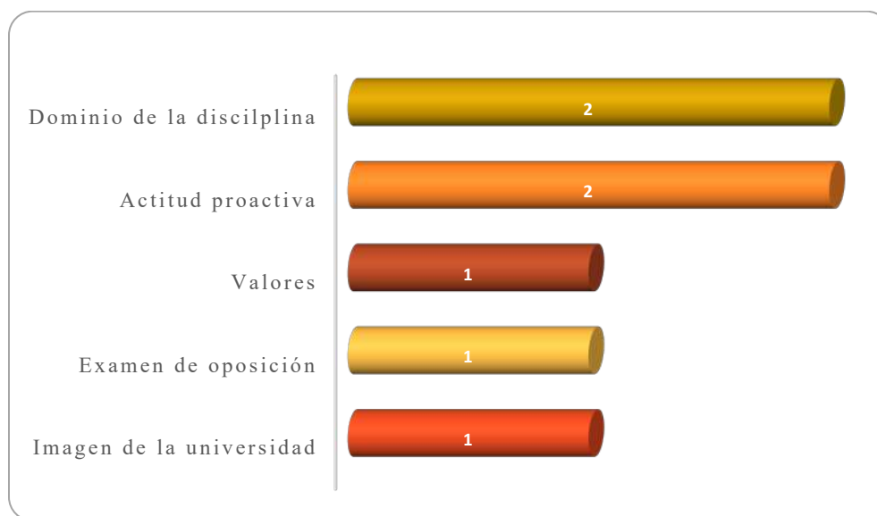
Gráfica 2.2 Requisitos más importantes para determinar la contratación

Los requisitos que determinan la contratación de los egresados se muestran en la Gráfica 2.2. Observándose que los dos empleadores consideran principalmente el dominio de la disciplina y la actitud proactiva mostrada por los egresados. Otros requisitos indicados fueron: los valores, el examen de oposición y la imagen de la universidad.