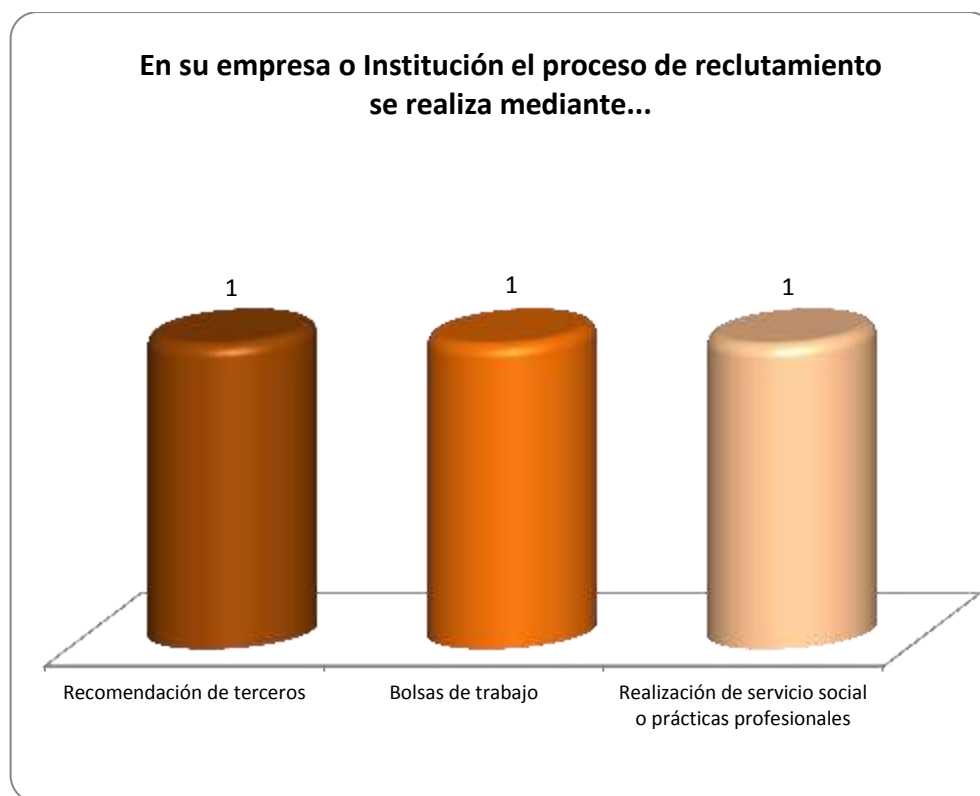
Gráfica 2.1 Medios de reclutamiento más utilizados por los empleadores y sus frecuencias de uso

A continuación en la Gráfica 2.1 tenemos 3 opciones que se utilizan como indicadores para observar los medios más frecuentes de reclutamiento.