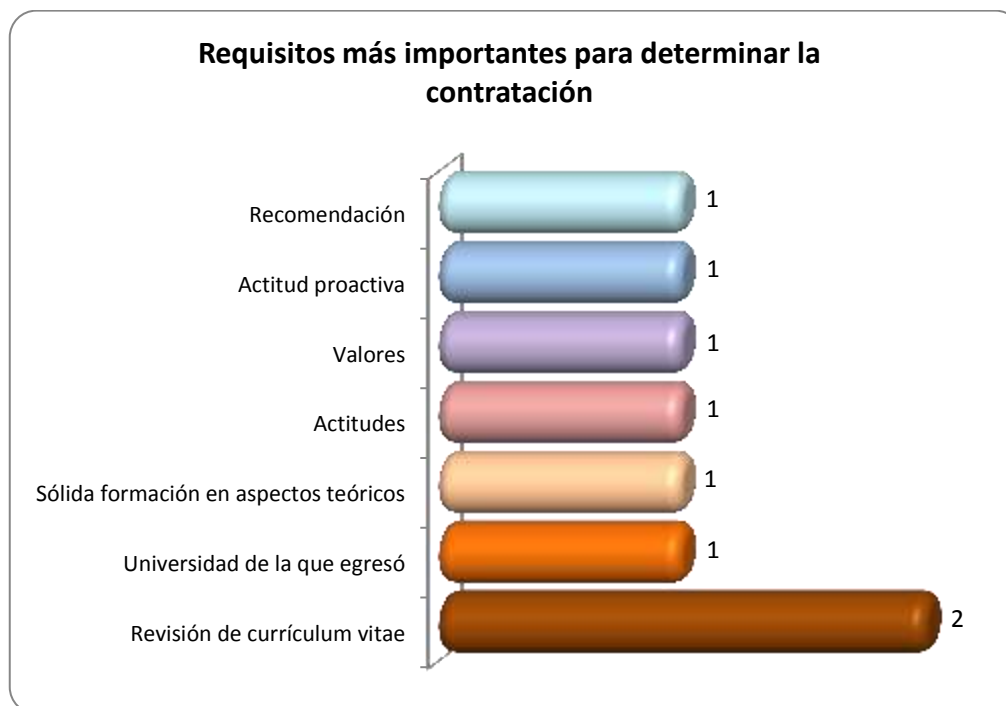
Gráfica 2.2 Requisitos más importantes para determinar la contratación

Otros requisitos importantes que requieren para determinar la contratación de los egresados se muestran en la Gráfica 2.2.