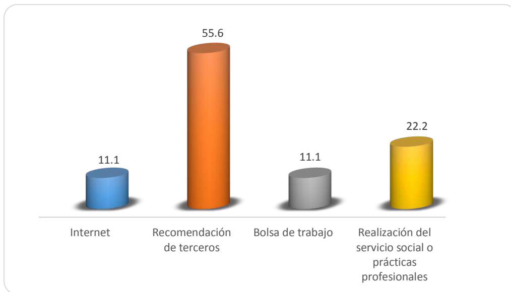
Gráfica 2.1 Medios de reclutamiento más utilizados por los empleadores y sus frecuencias de uso

La Gráfica 2.1 muestra los medios de reclutamiento para el proceso de contratación observándose que el mayormente utilizado por los empresarios y/o recursos humanos es a través de la recomendación de terceros con 55.6%, siguiendo la realización del servicio social o prácticas profesionales con el 22.2%, en un nivel inferior se encuentra el uso de internet y la bolsa de trabajo con 11.1% respectivamente.