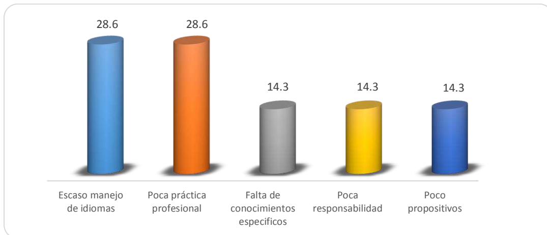
Gráfica 2.3 Principales debilidades de los egresados al momento de la contratación

En la Gráfica 2.3 se observa que la debilidad considerada como la más importante es: el escaso manejo de idiomas y la poca práctica profesional con 28.6%, en un nivel inferior se encuentran aspectos como la falta de conocimientos específicos, la poca responsabilidad y poco propositivos con 14.3% respectivamente.