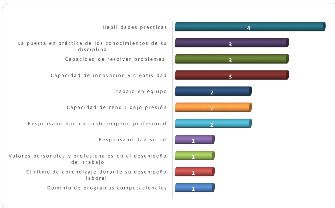
Gráfica 3.1 Aspectos más importantes que poseen los egresados de esta licenciatura, considerados por los empleadores

egresados del programa educativo de Enfermería que se imparte en la Escuela Superior de Huejutla.