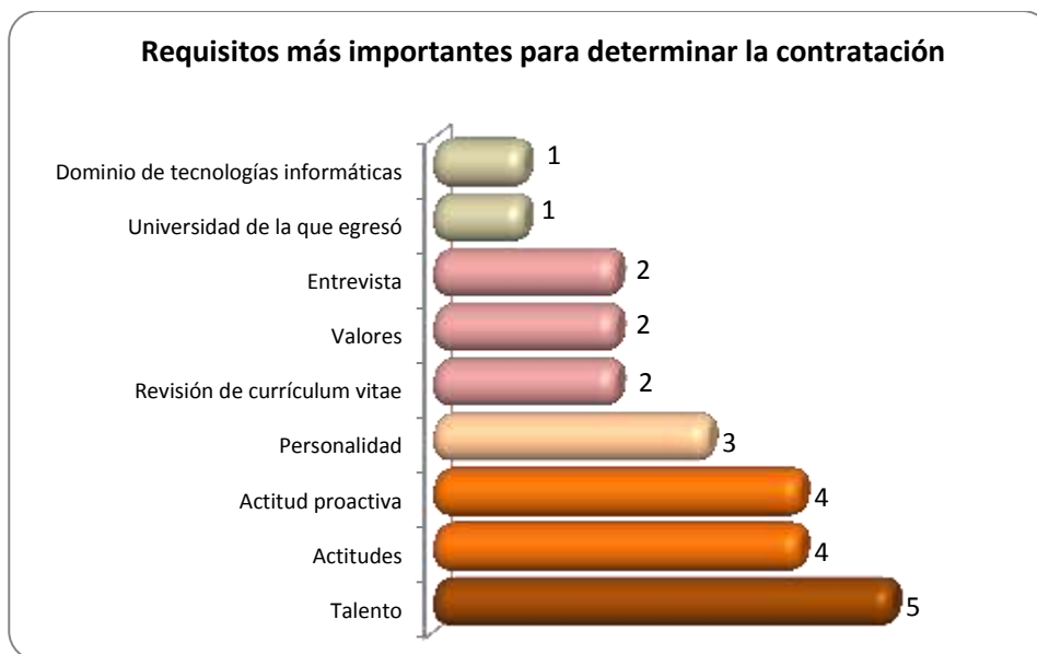
Gráfica 2.2 Requisitos más importantes para determinar la contratación

Otros requisitos importantes que requieren para determinar la contratación de los egresados se muestran en la Gráfica 2.2.