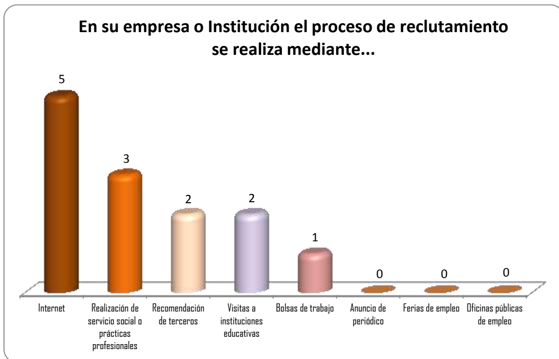
Gráfica 2.1 Medios de reclutamiento más utilizados por los empleadores y sus frecuencias de uso

A continuación en la Gráfica 2.1 tenemos 5 opciones que se utilizan como indicadores para observar los medios más frecuentes de reclutamiento, donde el medio más utilizado es internet y la realización de servicio social y prácticas profesionales, esto en la opinión de 5 y 3 empleadores respectivamente.