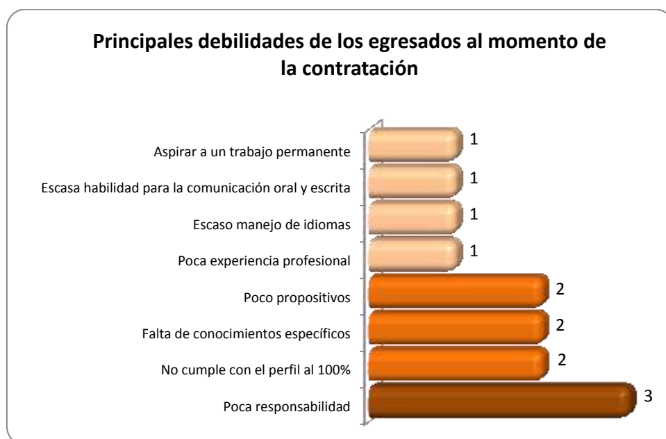
Gráfica 2.3 Principales debilidades de los egresados al momento de la contratación

En la Gráfica 2.3 se observa que las debilidades consideradas como las más importantes son: poca responsabilidad, esto en la opinión de 3 empleadores; también que no cumple con el perfil al 100%, la falta de conocimientos específicos y que son poco propositivos, esto considerado por 2 empleadores en cada aspecto.