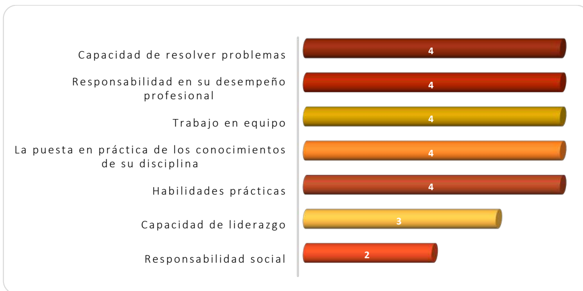
Gráfica 3.1 Aspectos más importantes que poseen los egresados de esta licenciatura, considerados por los empleadores

respectiva. Otras capacidades consideradas fueron: la capacidad de liderazgo y la responsabilidad social, ver Gráfica 3.1.