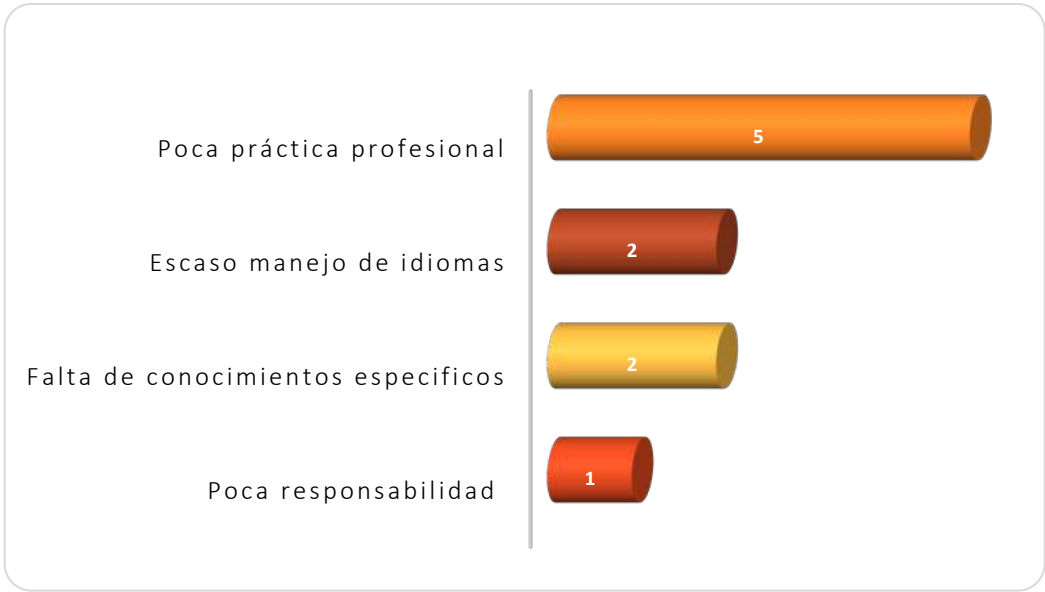
Gráfica 2.3 Principales debilidades de los egresados al momento de la contratación