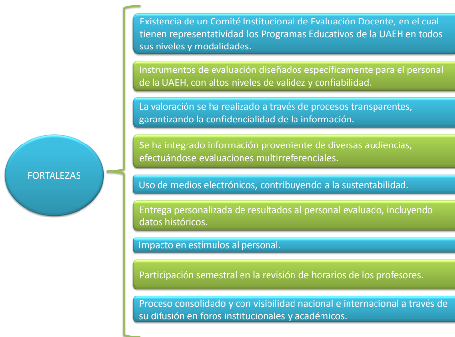
Figura 8. Fortalezas

A partir del panorama anterior, se pueden identificar las siguientes fortalezas y áreas de oportunidad.