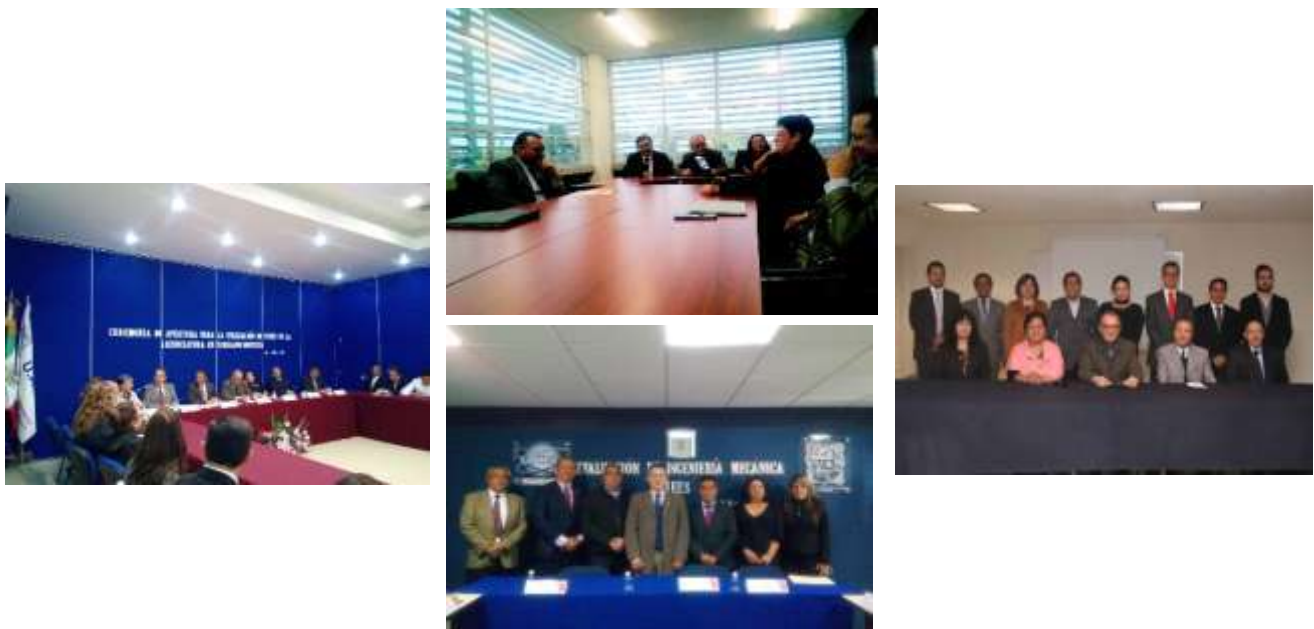
Imagen. Reuniones de apertura de los trabajos de evaluación de los CIEES

La primera actividad señalada en la agenda de actividades de las Comisiones de Pares Académicos es la sesión de apertura, la cual es presidida por las principales autoridades de la Institución y de las DES dando así inicio formal a las visitas de evaluación.