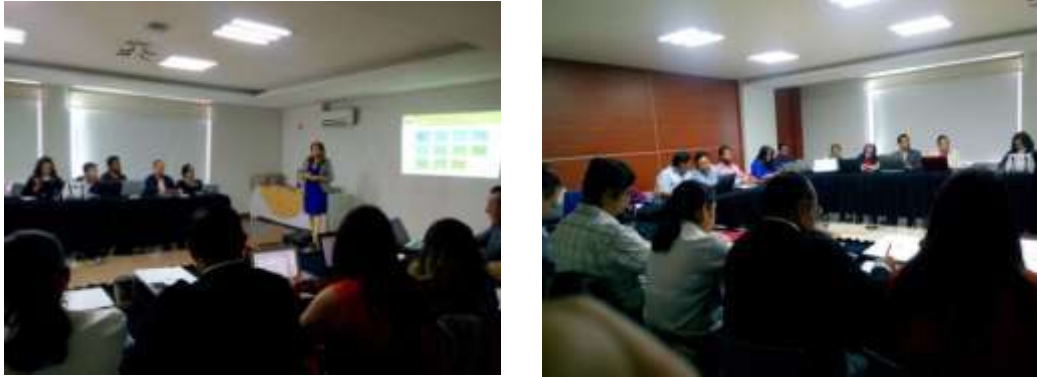
Imagen 2. Sesión del Taller impartido a coordinadores y profesores

A partir de mayo, se inició el trabajo de revisión y asesoría de los programas educativos para la integración del informe de autoevaluación, teniendo al menos dos revisiones por programa educativo hasta culminar con el llenado del instrumento mediante la plataforma electrónica de los CIEES, actividad que se llevó a cabo a partir de la primera semana de julio hasta la última de septiembre.