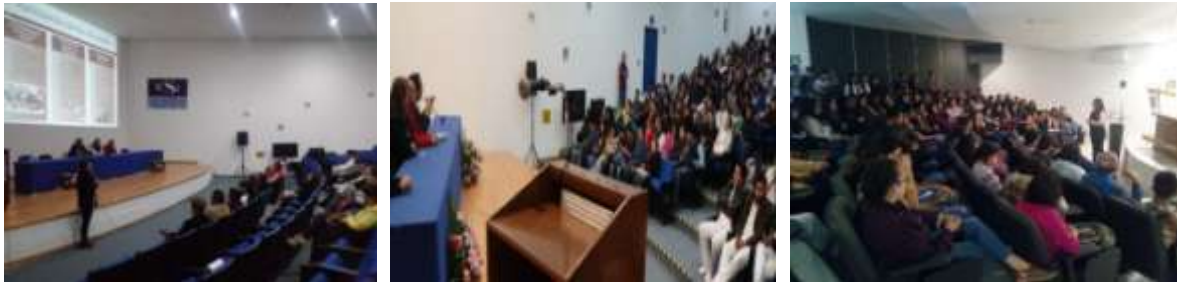
Imagen. Difusión de la importancia de la evaluación en los PPEE.

Se realizaron sesiones informativas en los meses de septiembre, octubre y noviembre con alumnos y profesores de todos los programas educativos que fueron evaluados, abordando aspectos relevantes sobre el proceso y haciendo énfasis en el necesario compromiso de la comunidad para contribuir a la mejora continua y aseguramiento de la calidad.