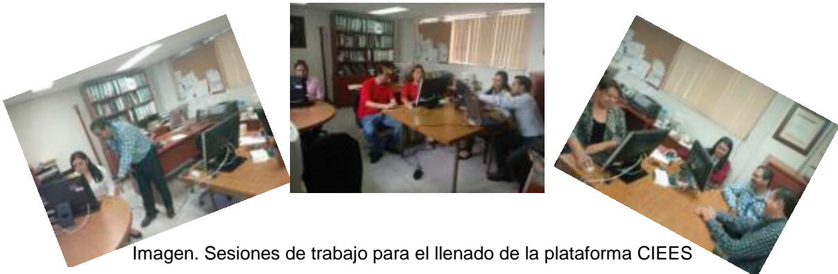
Imagen. Sesiones de trabajo para el llenado de la plataforma CIEES