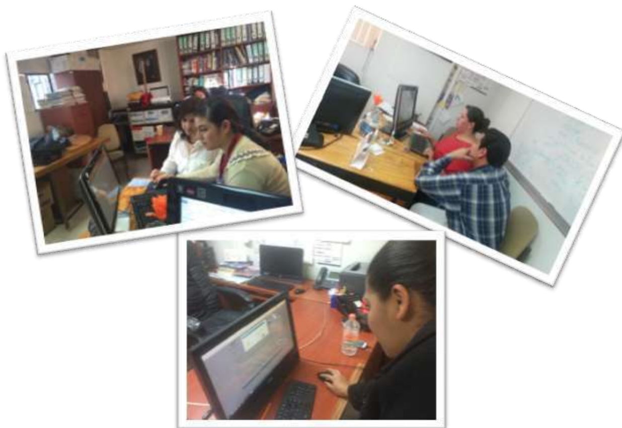
Imagen 3. Sesiones de trabajo para el llenado de la plataforma CIEES