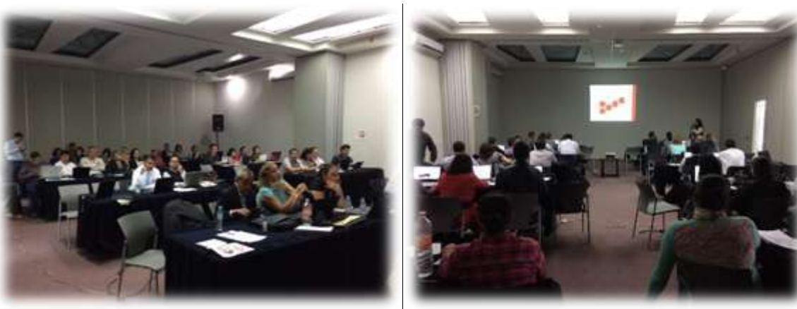
Imagen 1. Capacitación para el proceso de evaluación de los CIEES. Metodología 2016

Durante la sesión se realizaron diversas actividades como la presentación y distribución de los documentos que integran la metodología de los CIEES, análisis de indicadores, ejercicios de autoevaluación mediante el uso de la Guía de Autoevaluación para los Programas de Educación Superior (GAPES), principal instrumento de la metodología de los CIEES para el proceso de autoevaluación; explicación de la dinámica institucional a seguir durante el proceso de evaluación así como el cronograma de actividades para la integración y revisión del informe de autoevaluación así como de las evidencias a presentar.