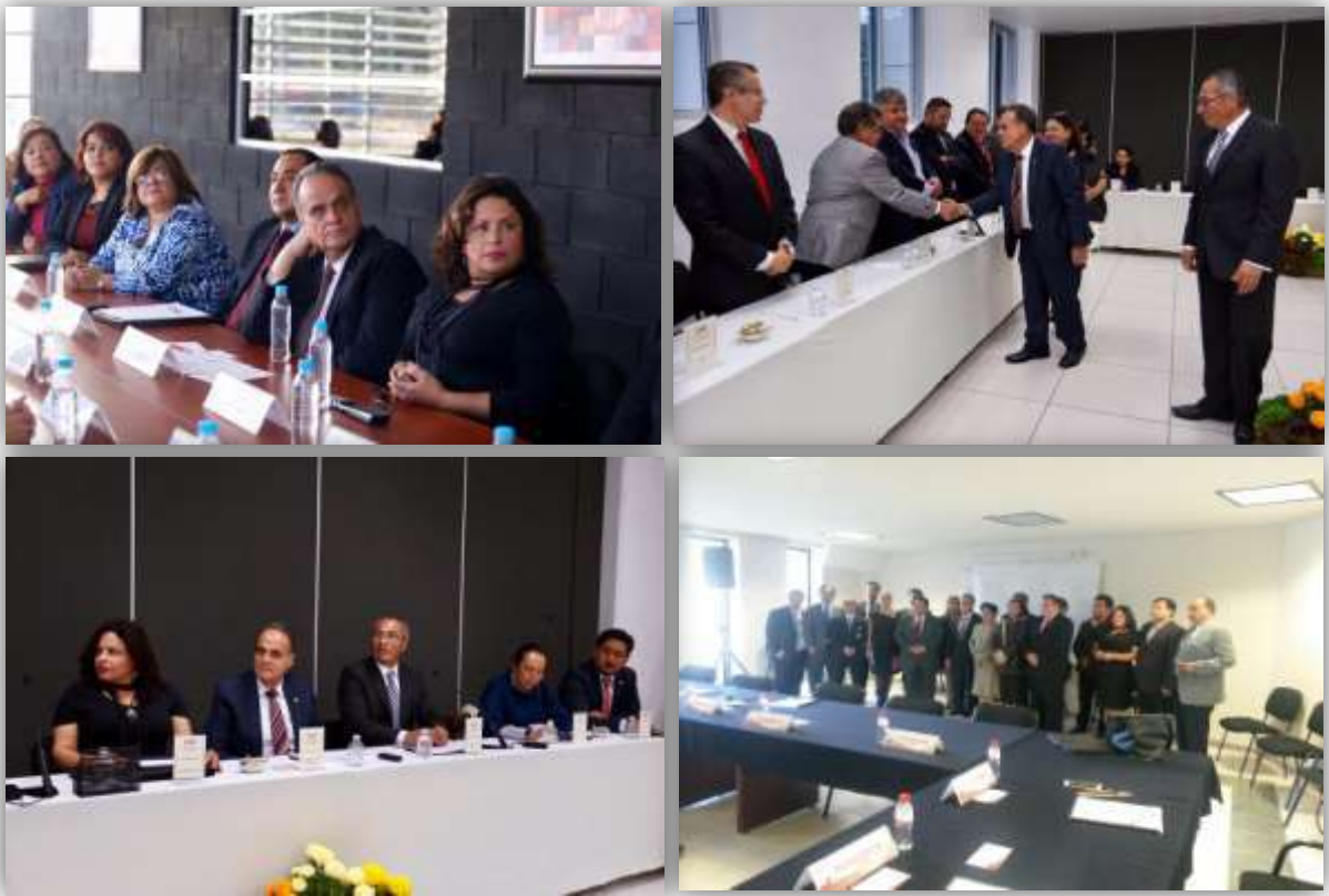
Imagen 4. Reuniones de apertura de los trabajos de evaluación de los CIEES

La primera actividad señalada en la agenda de actividades de las Comisiones de Pares Académicos es la sesión de apertura, la cual es presidida por autoridades de la Institución y de las DES dando así inicio formal a las visitas de evaluación.