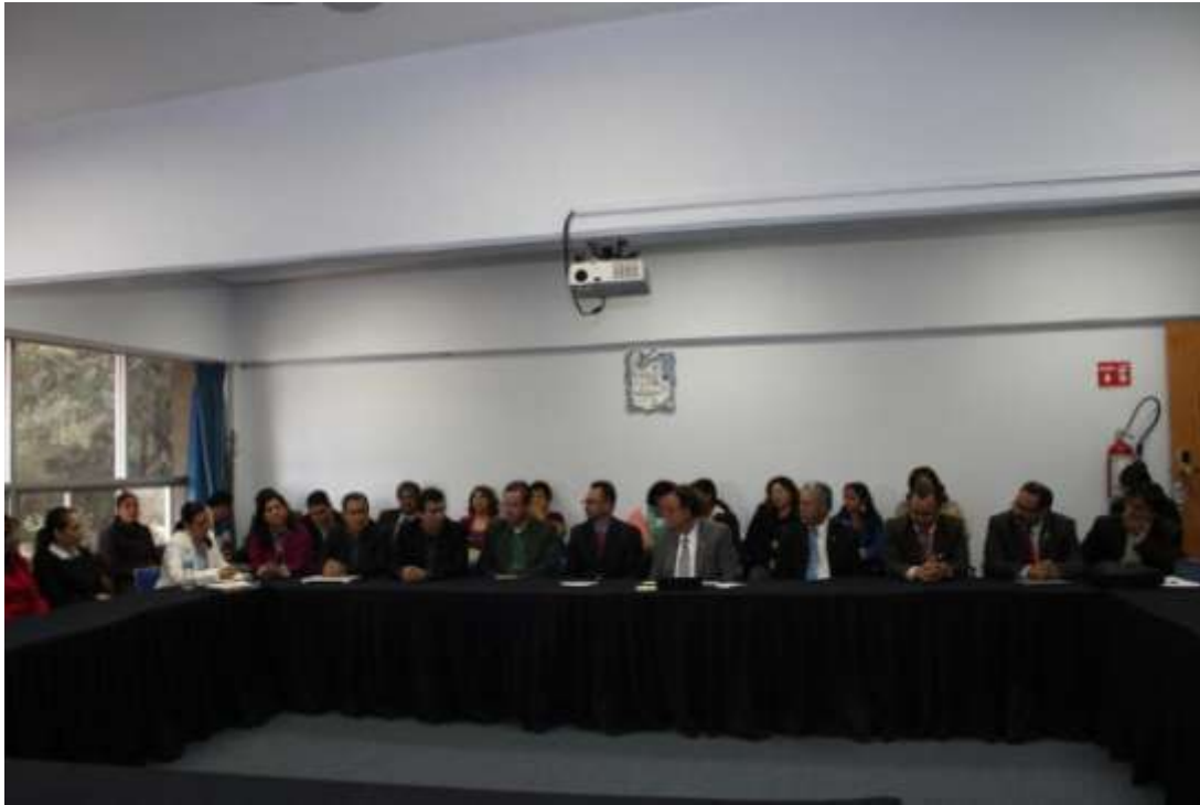
Imagen 1. Reunión de apertura de la Visita del Comité de Ciencias Naturales y Exactas de los CIEES a los programas de Biología, Química y Química en Alimentos del Instituto de Ciencias Básicas e Ingeniería.