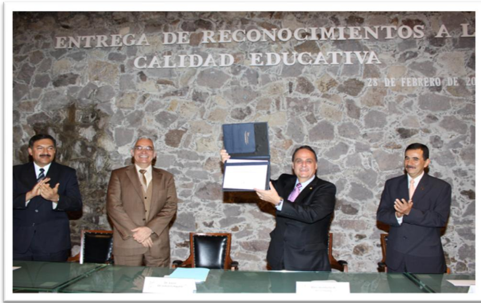
Imagen 2. Entrega de reconocimiento a la calidad educativa de la UAEH, febrero de 2012