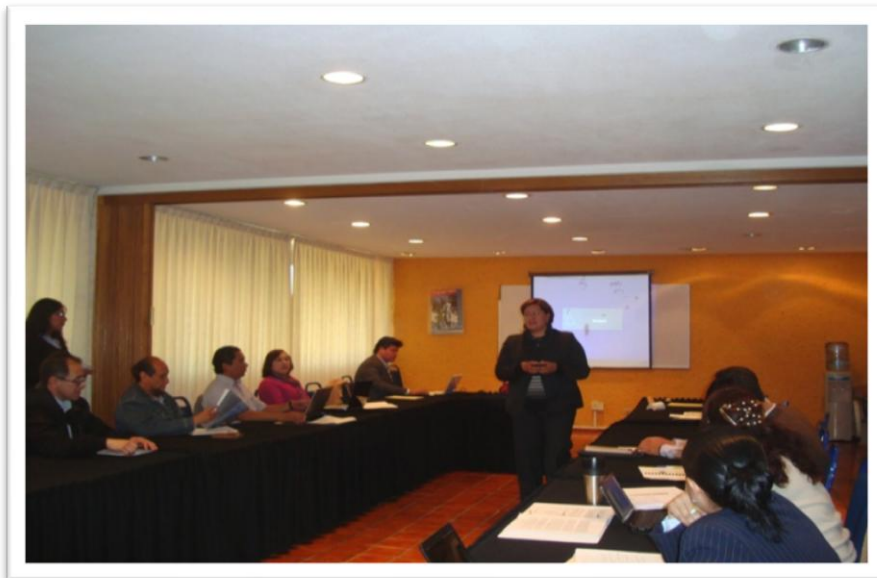
Imagen 4. Taller de preparación de los PPEE no evaluables

A partir de esta capacitación, los coordinadores realizarán un primer ejercicio de autoevaluación, a través del cual podrán identificar las fortalezas y debilidades de sus respectivos programas y las acciones de mejora que deben implementar en tanto adquieren el estatus de evaluables. Asimismo, estarán en posibilidades de organizar su información con base en los lineamientos establecidos.