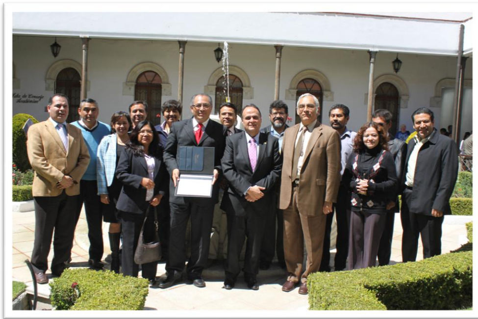
Imagen 3. Entrega de reconocimiento a la calidad educativa, febrero de 2012

A la Dirección General de Evaluación le corresponde planear, organizar, dirigir, y evaluar los procesos de evaluación institucional para el aseguramiento de la calidad de las funciones sustantivas y la eficiencia de la gestión administrativa, según lo establecido en el Estatuto General de la UAEH.