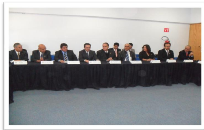
Imagen 1. Reunión de apertura de la evaluación de los CIEES al PE de Ingeniería Civil

En octubre de 2011 se realizó el mismo proceso con el programa de Ingeniería Civil que adquirió entonces su evaluabilidad, el cual también obtuvo el reconocimiento de los CIEES quienes le otorgaron el nivel 1, lo cual permitió refrendar el reconocimiento de la institución a nivel nacional.